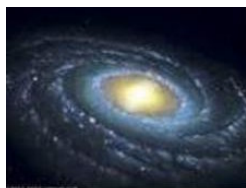
راه شیری Milky Way

زیرا درخت کاج ارتباطی با مسیحیت نداشته است بلکه ریشه این سنت در تمدن، آئین و دانش ایرانیان باستان است. در آئین مهر (میتراپسم) اخترشناسی (نجوم) جایگاه خاصی داشت و رهبران دینی آنروز (یعنی مغها) بیش از آنکه رهبران دینی باشند اخترشناسان زبردستی بودند چونکه در آئین مهر از راه اخترشناسی و شناخت کهکشان و سیاره‌ها (اجرام سماوی) و تاثیر آنها بر کره زمین و زندگی انسان، به بررسی آفرینش و رمز و راز آن میپرداختند. از اینرو منظومه شمسی که