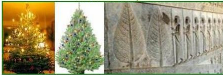
کریسمس یک پدیده ایرانیست که ریشه‌های سنتی آن در ایران یافت میشود. آئین مهر!