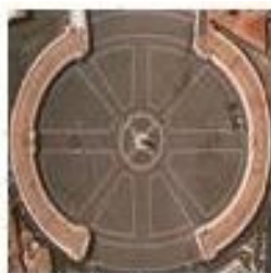
تندیس مهر در میدان اصلی واتیکان