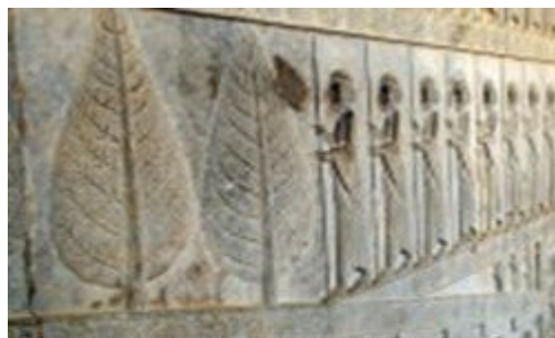
Yalda tree (today's Christmas tree) in Persian capital Perspolis about 3000 years ago.

در مرکز آن مهر (یعنی خورشید) قرار دارد بسیار مورد توجه مغهای اخترشناس بود و درخت سرو را که درختی مقاوم در برابر سرمای زمستان و سمبل مبارزه با سرما و تاریکی بود، مقدس میشمردند و آن را در شب زایش نور یعنی شب یلدا به شکل منظومه