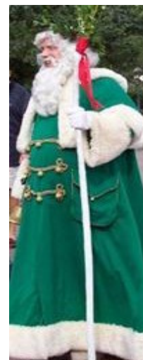
Santa Claus looking like Persian Magis

اخترشناسان هدیه آور نسبت داده شده است. پس از قرن ها، ماگی (یعنی همان مغها) که لباس آنان همچون بابا نوروز، بابا نونل و کشیشان امروزی بود، به نام بابا نونل یا سنتاکلاس نامیده شد که برای کودکان هدیه می آورد. در حقیقت بابا نونل همان ماگی (مغ) هدیه آور است که برای نوزاد و مادرش (یعنی عیسی مسیح و مریم) هدایایی برده بودند. بنابراین، در زبان فارسی، به جای بابا نونل بهتر است بگوئیم "بابا یلدا" که واژه ای است با مفهومتر و مرتبط به فرهنگ ایرانی.