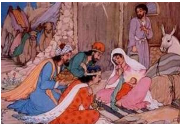
سه اختر شناس ایرانی (مغ) در دیدار با عیسی مریم (نقاشی از استاد بهزاد) Three Persian Wise Men, Magis visiting Mary and Jesus baby

به روایتی در مسیحیت، سه مغ از ایران، که ستاره شمالی را در آسمان مشاهده کرده بودند و همزمان از تولد مسیح تازه‌ای (یعنی عیسی مسیح) خبر دار شده بودند، به دیدن وی رفتند. در مسیحیت این مغها را ماگی نامیده‌اند که تلفظ انگلیسی همان واژه مغ است و واژه مجیک (magic) انگلیسی نیز ریشه در واژه مغ ایرانی دارد (یعنی کسی که از علم غیب و سحر آگاه است). از آنجایی که مغهای ایرانی جامه‌های نفیس و زرین در بر داشتند، برخی از مسیحیان قدیم گفته‌اند که اینان سه پادشاه بوده‌اند، ولی در حقیقت آنان سه مغ بودند و در ادبیات مربوطه نیز آنان را به ماگی (یعنی مغ) نام برده‌اند.