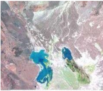
Lake of Hamoun, in south of Iran

داستان تولد مسیحا پدیده‌ای است که هزاران سال پیش از میلاد مسیح در ایران باستان در کیش مهر دیدگاه ایرانیان باستان بر این بوده است که نور نماد افریدگار مهر و دوستی است که همیشه با تاریکی در جنگ است. بر طبق اسطوره‌های ایرانی از الاهی‌ای باکره به نام آناهیتا، در شب یلدا که بلندترین شب سال است، فرزندی چشم بر جهان می‌گشاید و او را فرزند افریدگار، مهر (میترا) مینامند، یعنی نماد مهر و دوستی، ناجی و مسیحای زمان. از سویی تشبیه به فرزندی است که از مادر زاییده میشود، و از سویی این فرزند چیزی غیر از خود نور نیست، یعنی نماد افریدگار!