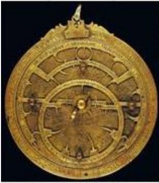
Astrolabe (آسترلاب). A Persian Astronomical Instrument

تلفظ درست خرابات در شعر بالا "خورابات" است. در این شعر، حافظ اشاره دارد به نیایشگاه کیش مهر یعنی خورابات (دیر مغان). خور به معنای خورشید یعنی مهر است و خورابات یعنی نیایشگاه (دیر) کیش مهر. حافظ اشاره کرده است که کیش مهر آیین مهربانی و دوستی و خداشناسی است که در آن عنصر نور و مهر نماد افریدگار و راه هدایت به سوی پروردگار است. بنابراین جای شگفتی ندارد که این عنصر نور را، که برگرفته از آیین مهر است، در تمام ادیان بعدی نیز (چون مسیحیت، یهودیت، اسلام) مشاهده می‌کنیم. از اینرو حافظ اشاره به نور خدا در آیین کهن مهر دارد و مغان را مردان خدا میداند. نماد میترا (مهر) خورشید و نور است و ازینرو دیر مغان را خورابات می‌گفتند که بیشتر از آنکه نیایشگاه باشد رصدخانه بوده است و از طریق رصد کردن ستارگان و موقعیت آنها در هر زمان نسبت به زمین پی‌به‌رمز و راز هستی‌می‌بردند. استرلاب یکی از وسایل رصد کردن آنها بود که دستگاه مکان سنجی بوده و GPS زمان خود!