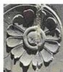
تندیس مهر فروزان در تخت جمشید