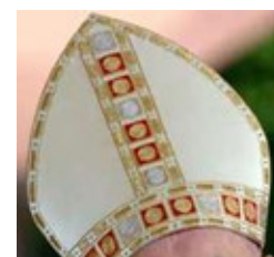
کلاه پاپ، میترا Mitra, hat of Pope