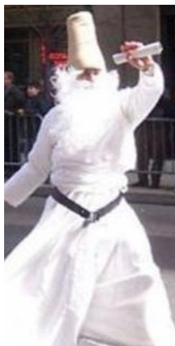
Uncle Nowruz in the Persian New Year Festival

مغها هدایایی نیز برای کودک نوزاد (مسیح) به ارمغان آورده بودند. از اینرودر مسیحیت واژه ماگی (مغ) به