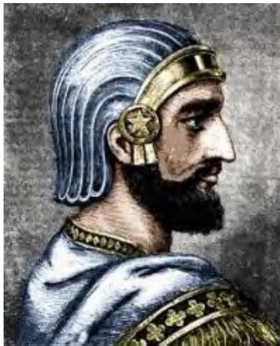
Cyrus (580-529 BC), the first Emperor of Persia